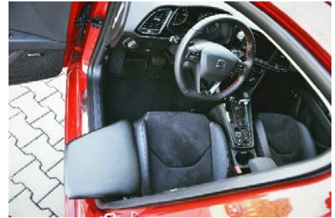
Suurempi levy pehmeällä verhoilulla